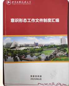
意识形态工作文件制度汇编