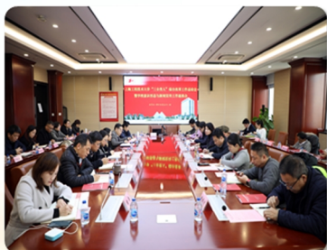
学校召开学校意识形态与新闻宣传工作通报会