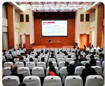
校党委理论学习中心组举行“新时代高校意识形态工作的成绩、挑战与对策”专题(扩大)学习会