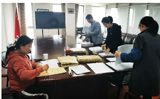
离试点推进情况交流会。

会上，各位课程负责人详细介绍了试点课程的实施过程，教务处与相关学院院长及负责教师就课程教学研讨环节、命题环节、组卷环节、阅卷环节以及成绩分析比对等环节做了深入交流；围绕如何根据教学大纲、学生能力要求来选取课程考查的知识点、题型设置等组织了教学研讨；围绕命题环节如何制定考试大纲、建设试题库，组卷环节对命题教师的遴选、试卷印刷和保管，试卷分发和回收、阅卷与核查、成绩数据分析、学生能力的提升对比，以及绩效考核评价等环节展开热烈深入的研讨，总结出了诸多建设性意见。教务处特别对教师提出的教考分离课程现阶段在实施过程中存在的问题，例如：学生成绩分析、试题库建设质量，试卷保密